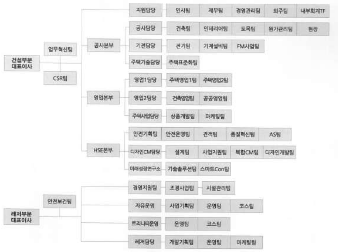
신세계건설 조직도 21년